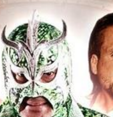
ULTIMO DRAGON ANCIEN DE LA WWE ET WCW