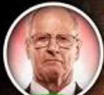
JOHNNY SAINT WWE UK GM